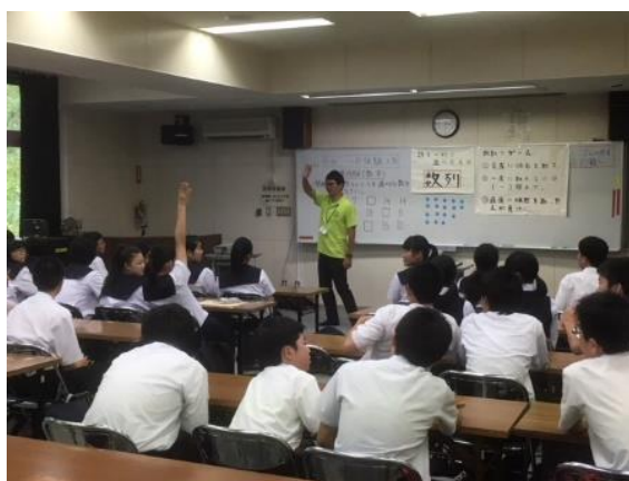
↑ 数学「数列」体験授業の様子