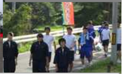
中高一貫クリーン作戦の様子