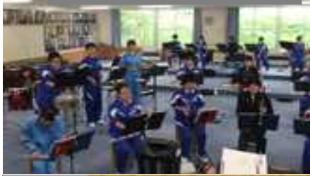
吹奏楽部合同練習の様子