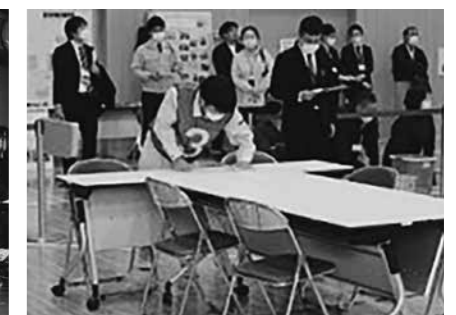
技能認定会・沿岸南部会場