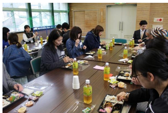
美味しいお弁当でした。