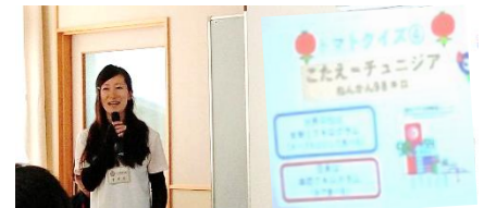
「イタリアではなく・・・」