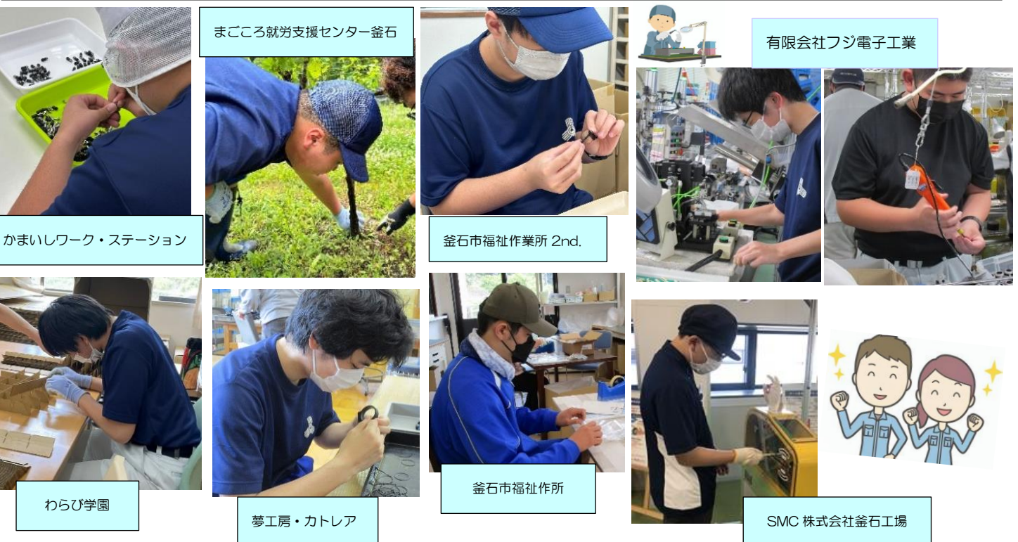
まごころ就労支援センター釜石