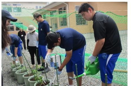
水やり「大きくな～れ」