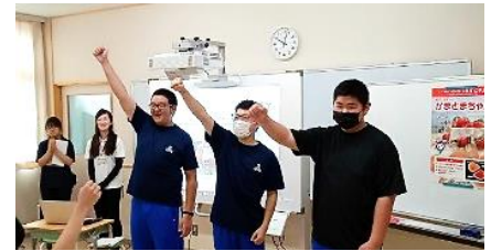
「がんばって植えるぞ!!」

これから、水をやったり、肥料をやったりして沢山収穫できるように頑張ります。トマトいっぱい食べたいな～。