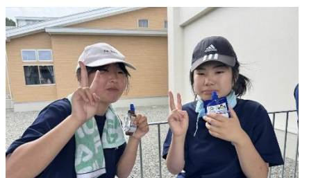
アイスでリフレッシュ