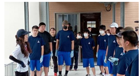
苗の植え方の説明