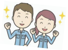
SMC 株式会社釜石工場