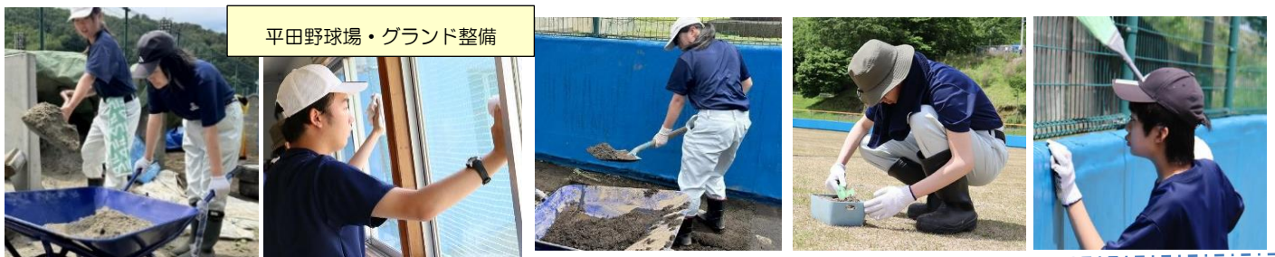
平田野球場・グラウンド整備