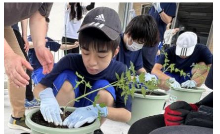
トマト、トマト、トマト・・・