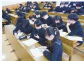
オリエンテーション