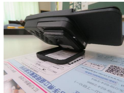
携帯型「オプタロー」

「TOPAZ PHD」トパーズ PHD。大画面と携帯性を両立した折りたたみ式の拡大読書器。ボタンも大きく操作しやすい。