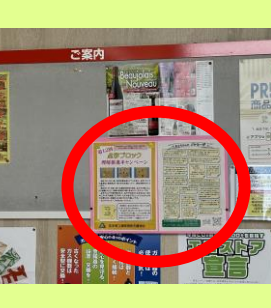
岩手マッサージセンター 肴町商店街(新規) プラザおでって(新規) 中央公民館 Big House上盛岡店