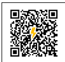
←雷ナウキャスト（気象庁）

顧問は、活動前に落雷の危険性を認識、事前に気象情報を確認するとともに、天候の急変などの場合にはためらうことなく計画の変更・中止等の適切な措置を講ずること。なお、雷注意報が出されている際は、屋外での活動を中止し、屋内での活動に切り替えらえるよう準備しておくこと。