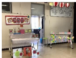
午後グループ：「まとあてや」