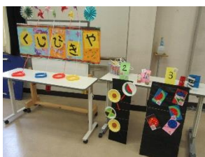
午前グループ：「くじびきや」

午前・午後グループで出店を二つにしたことから、準備段階から学部を超えて友達と関わり、協力して準備することができた。また、出店活動を精選したことから、当日の活動に余裕ができ、じっくりと出店を回ったり、友達同士、関わり合いながら活動を楽しんだりする様子がみられた。一日開催であっても、夏祭りの雰囲気を味わい、十分に活動することができた。