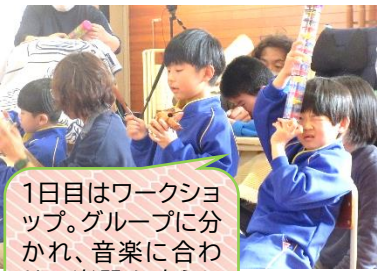
1日目はワークショップ。グループに分かれ、音楽に合わせて楽器を鳴らしました。

明日から、待ちに待った冬休みがスタートします。みんな、家族と過ごす時間を楽しみにしていることと思います😊この季節しかできない冬ならではの遊びをたくさん楽しんでください。 そして、冬休み明けは元気に登校して、先生たちに冬休みの思い出を教えてくださいね♪ 感染症が流行する季節です。体調に留意して楽しい冬休みをお過ごしください。