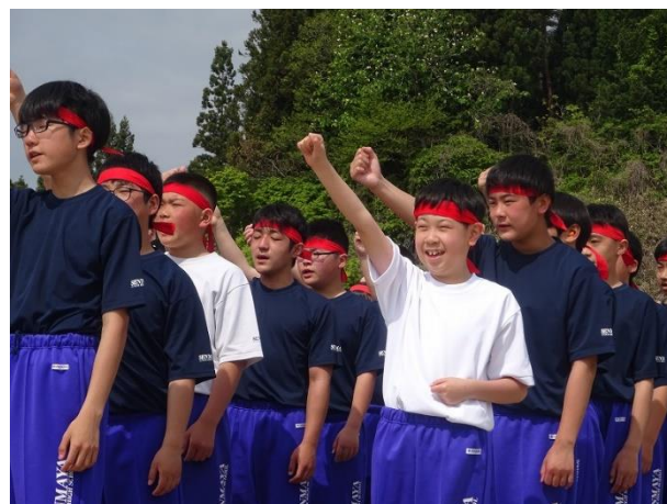
【千厩中と合同体育祭】