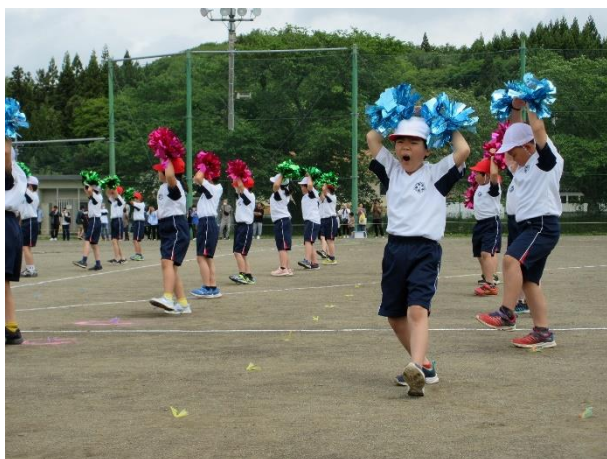
【千厩小と合同運動会】

これからも小・中学校との活動は継続し、地域との交流を積み重ね、より一層インクルーシブ教育を実践・推進していけるよう頑張ります。