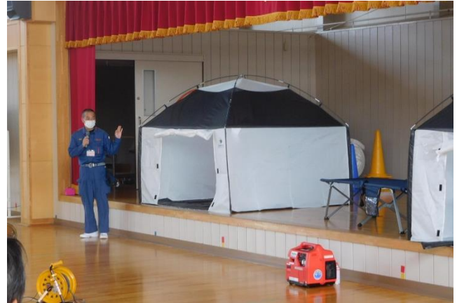
「一関消防本部さんからの災害時用の物品の説明」