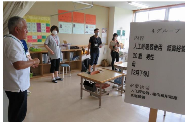
「グループ演習の様子」