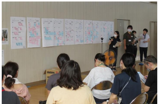
「グループごとの発表」