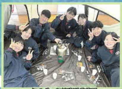
1年スポーツ健康科学系 キャンプ実習