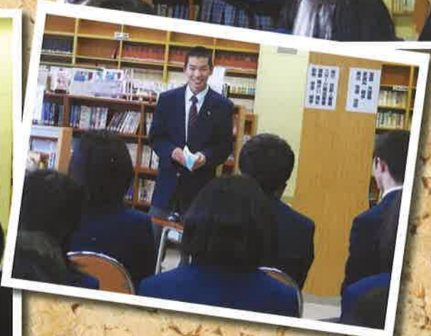
校内 百人一首 大会