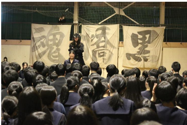
大きな声で言えるかな…。