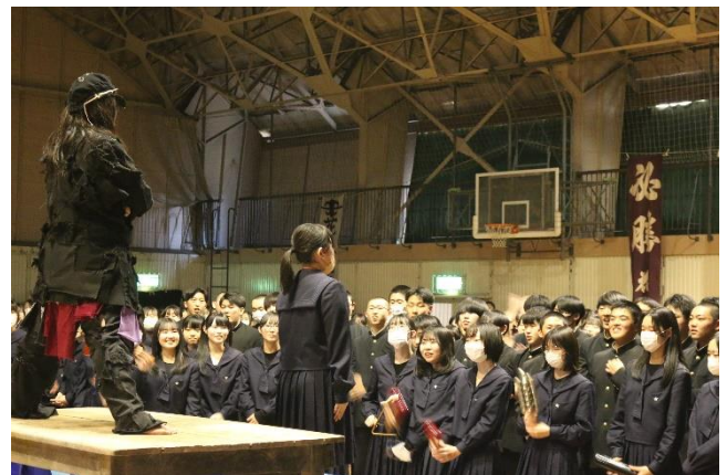
先輩達の前で緊張…。