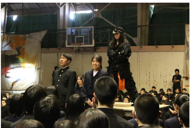
姉弟で。弟をよろしく！