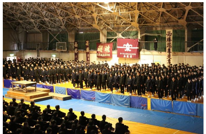
全員で乗り越えたぞ！