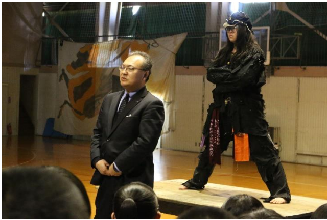
新任の先生たちも！

4月10日(水)、新1年生は入学して間もない中、応援団幹部、そして2、3年生の先輩たちの前で一人ひとり大きな声で自己紹介をしました。緊張の中、全226名が花高生として入団(仮)を認められました。次週に予定されている応援歌練習を乗り越えて、真の花高生として入団できるのです！新入生頑張れ！