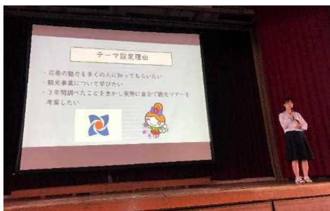
2位 佐藤和奏 花巻の地域活性化