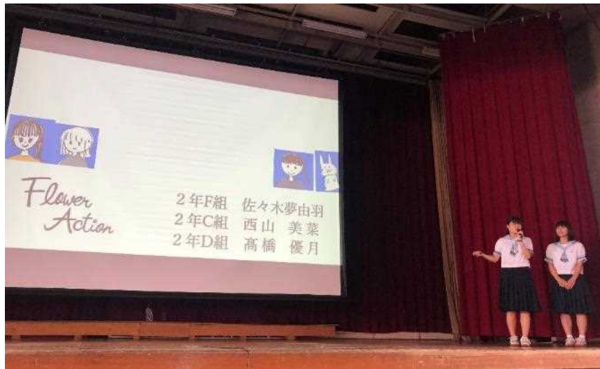
1位 Let's Work in Hanamaki 佐々木夢由羽 西山美菜 高橋優月