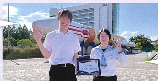
受領書を持ってJAXAの前で記念撮影

実際に衛星を近くで見ながら詳しい説明を受けたので、より衛星についての理解が深まりました。私たちの見た衛星が宇宙でミッションを行うと思うと、宇宙を身近に感じました。