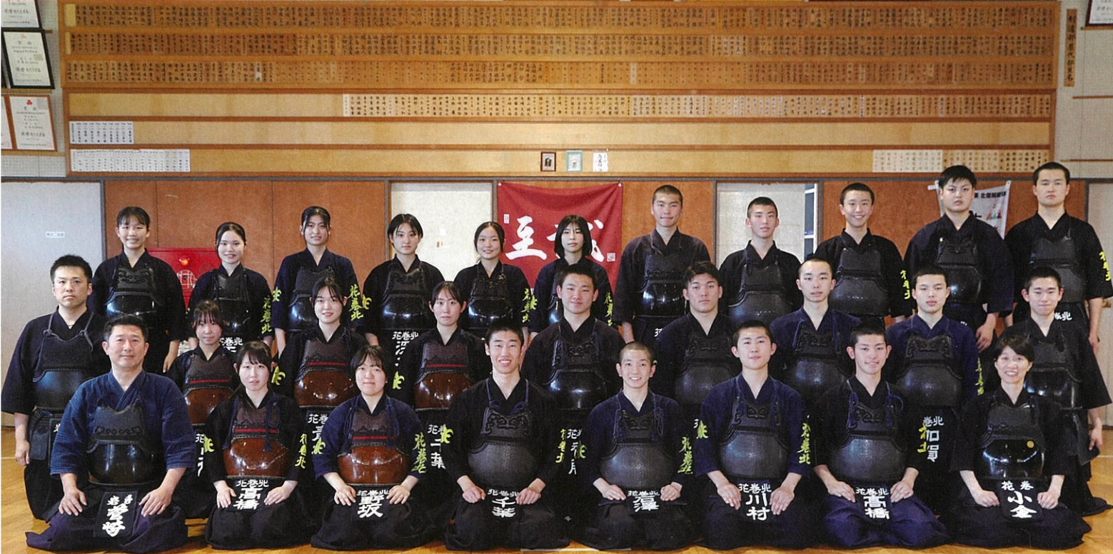
剣道部男子団体 3年ぶり7回目の県大会優勝