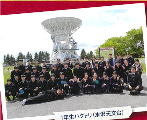
1年生ハウトリ(水沢天文台)