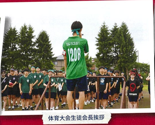
体育大会生徒会長挨拶