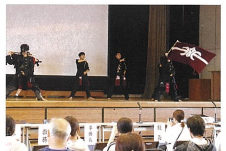
校歌・エール披露