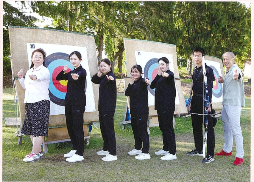
アーチェリー部女子団体 9年ぶり2度目の県大会優勝