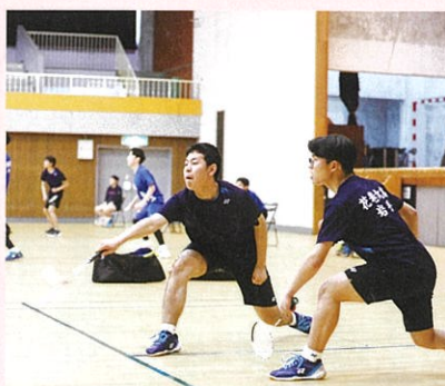
男子バドミントン