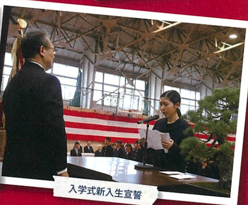
入学式新入生宣誓