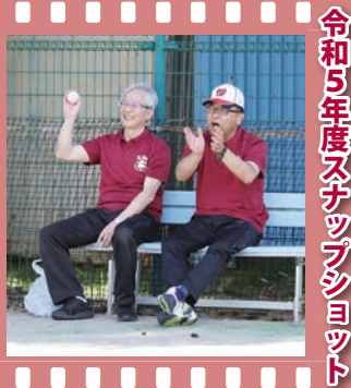
令和5年度スナックショット