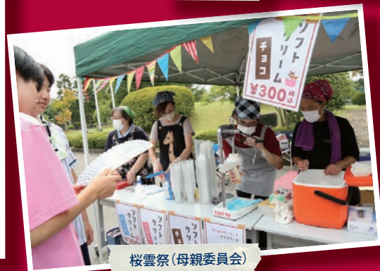
桜雲祭 (母親委員会)