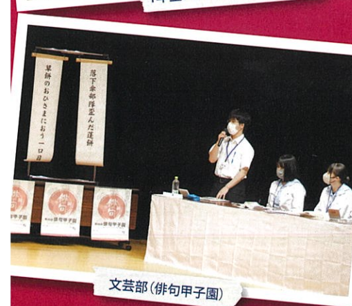
文芸部(俳句甲子園)