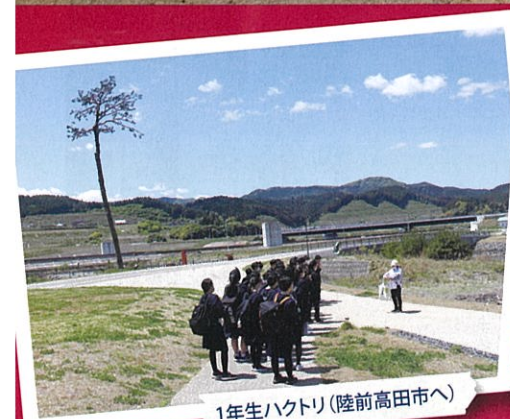
1年生ハクトリ(陸前高田市へ)