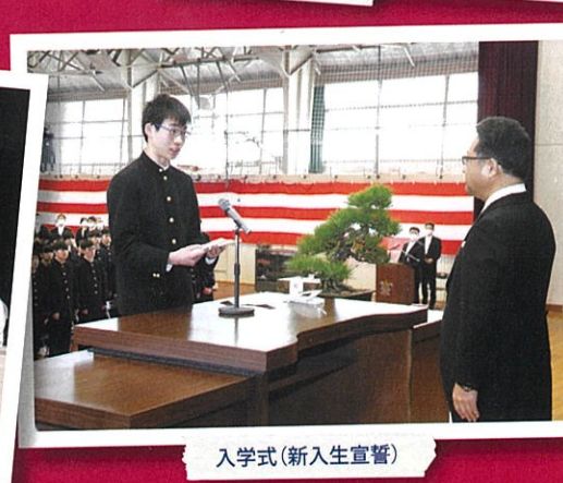
入学式(新入生宣誓)