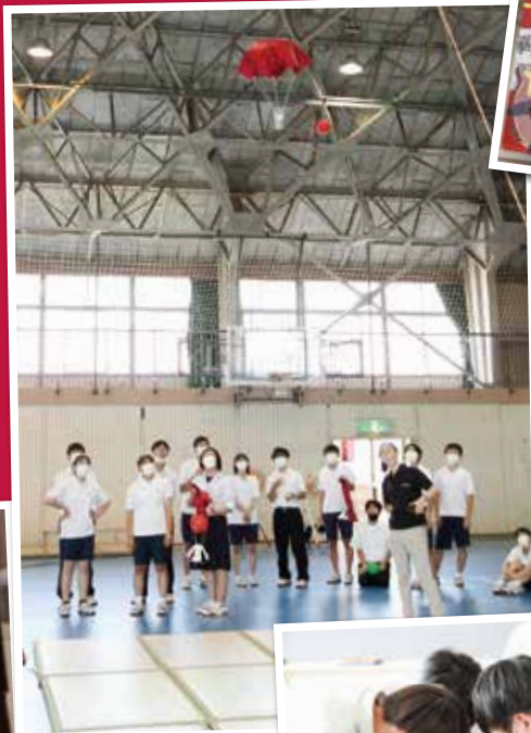
Can Sat (7月)