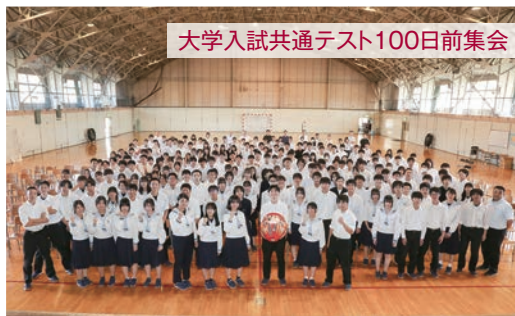
大学入試共通テスト100日前集会