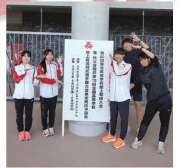
陸上競技部 (男子：岩手県特別強化指定校)