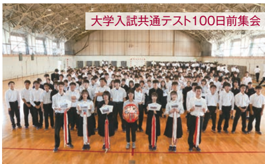
大学入試共通テスト100日前集会