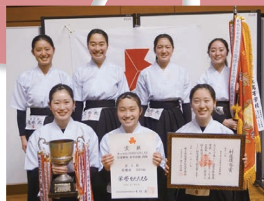
弓道部(女子: 岩手県高体連強化拠点校)