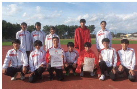
陸上競技部(男子: 岩手県特別強化指定校)