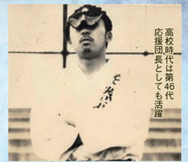
高校時代は第46代 応援団長としても活躍