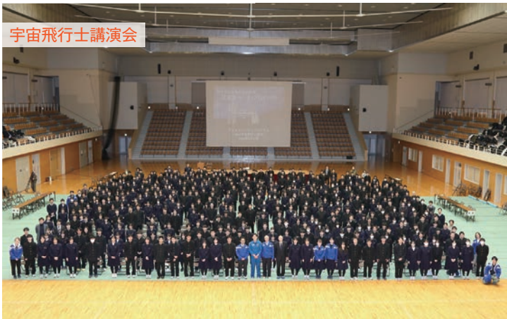
宇宙飛行士講演会

2024年秋、本校独自の人工衛星「YODAKA」打ち上げに向けた「衛星開発プログラム」の中で、東京大や岩手医大の教授、JAXAの指導のもと、学びを深めます。