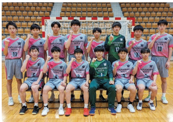
ハンドボール部(男子: 岩手県高体連強化拠点校)