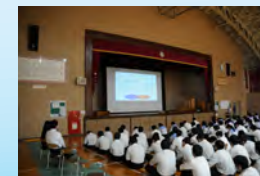
講話を聞く生徒たち