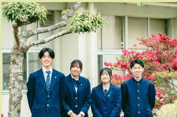
創立80周年に向けて走り始めた花泉高校です。新制服と旧制服が混在するのも今年が最後の年

初夏の爽やかな風が吹き抜ける道場で、静寂から一瞬の解放へと向かう、緊張感に満ちた瑞々しい青春のワンシーンを切り取りました。