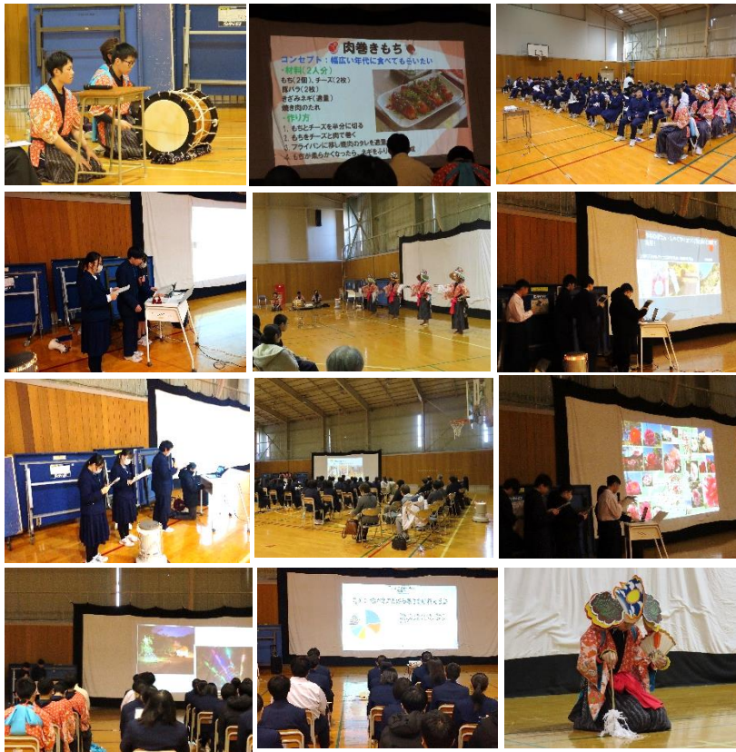
令和6年度花プロ「地域課題探究」発表会 プログラム

12/20(金)に今年度の花プロ「地域課題探究」発表会が行われました。4系統13グループが今年度取り組んだそれぞれの研究テーマについてその成果を発表しました。地域課題に目を向け、その課題解決に取り組むことは花高の大きな柱となっています。花高はこれからも地域と協働した学校を目指します。