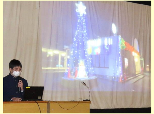
👉 【地域おこし・暮らし】グループは、花泉駅の冬のイルミネーションや環境整備活動、壁画の計画などを発表しました。