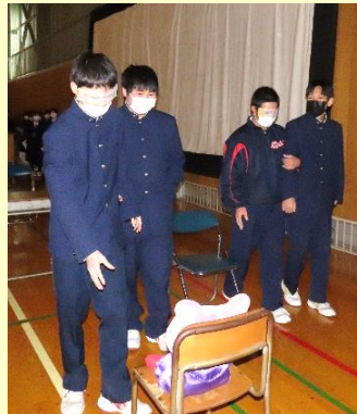
👉 【福祉B(介護)】グループは、白内障体験用の自作のゴーグルを使って、他の生徒に体験してもらいました。