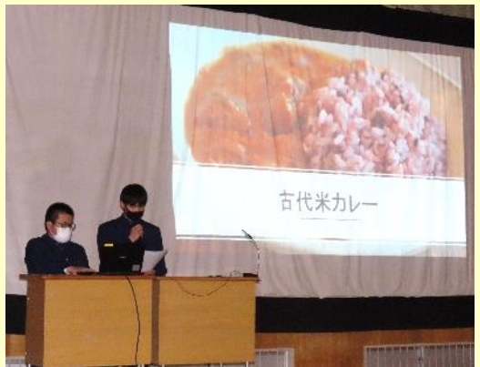
👉 【農業・畜産業・林業】グループは、第6次産業を実践している「古代米おりざ」の新メニューづくりに挑戦しました。