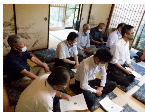
あぐら座での総会