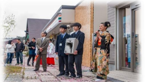
各種ボランティア活動