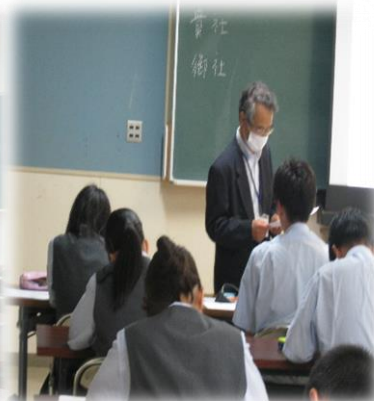
年間複数回行われる 進路ガイダンス