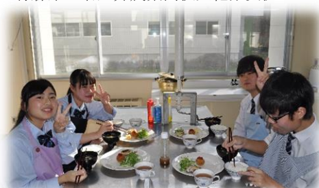
岩手県立平舘高等学校との学校交流