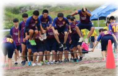
海の運動会 (H29から復活しました)