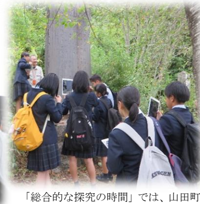
「総合的な探究の時間」では、山田町について調べ、自身の在り方生き方について考えています。