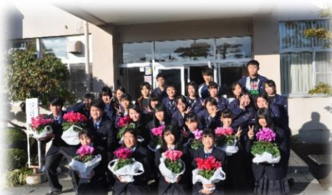
青森県立名久井農業高校文化祭交流