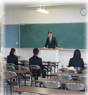
センター試験結団式