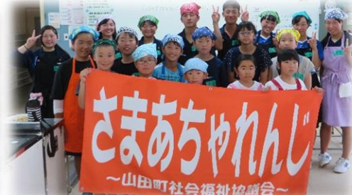
サマーチャレンジやまだ2019 (左：料理教室、右：科学教室)