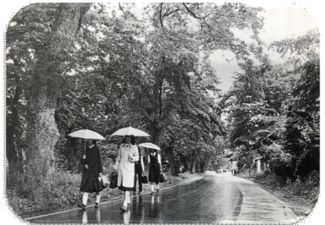
↑ さいかち並木「山田高等学校五十年史」より

また、昭和50年に創立50周年を記念し、これまでの文化祭の名称を「さいかち祭」とし、今日まで脈々と受け継がれています。