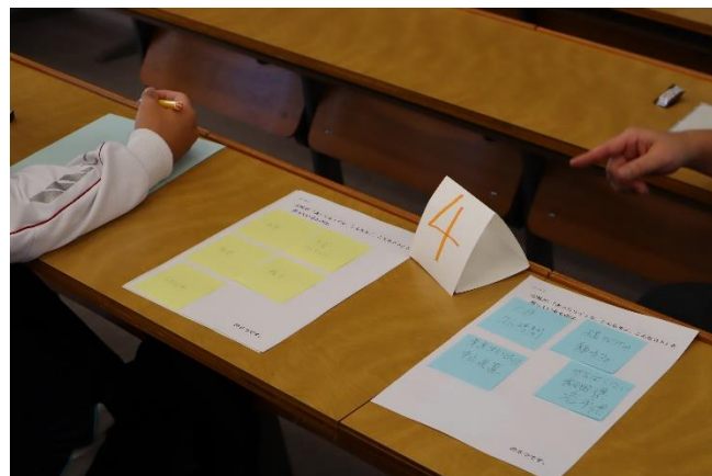
班員全員の意見を書いて貼ります。