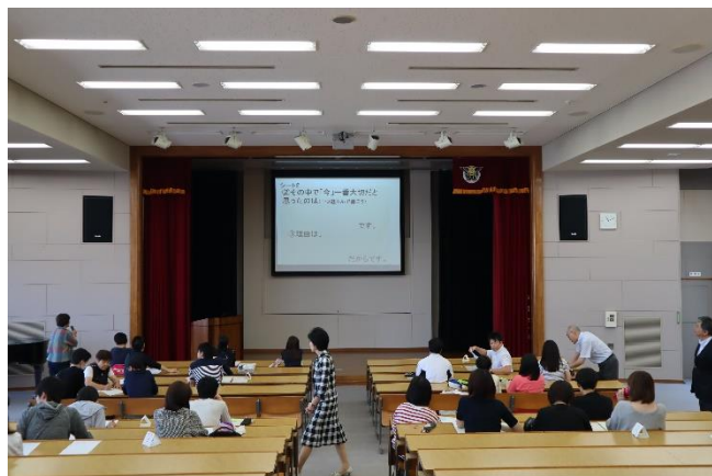
皆さん積極的に話し合いました。