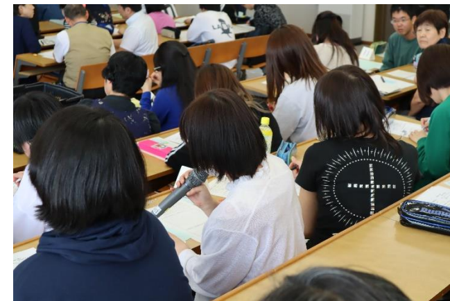
各班からの発表です。