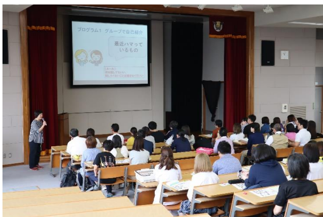
多目的ホールで講演会

今回は「あったらいいな、こんなモノ・こんなコト」というテーマでいろいろと話合いました。