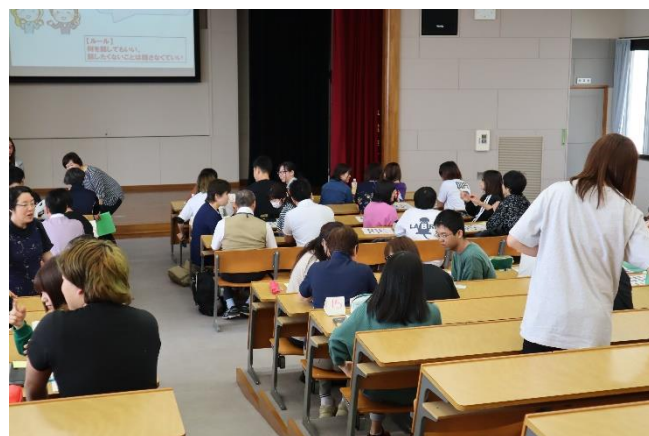
7日は4人で1つの班を作ると15班になりました。