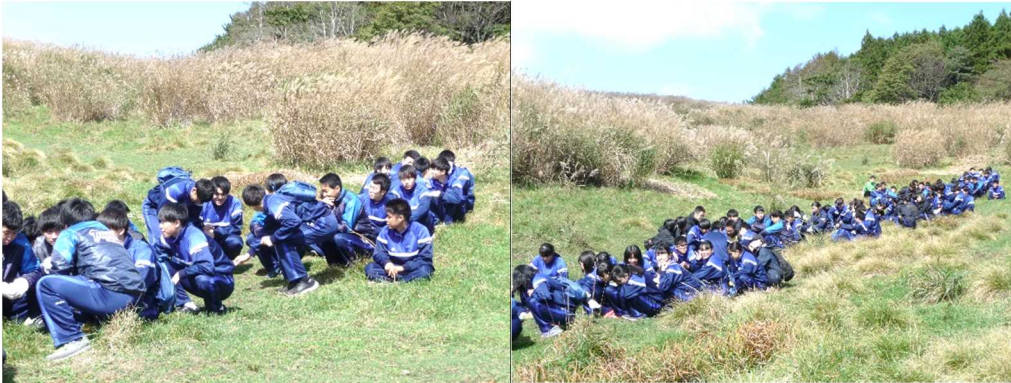
各隊配置につけっ!! 静かに静かに、うさぎの気配を待ちます。