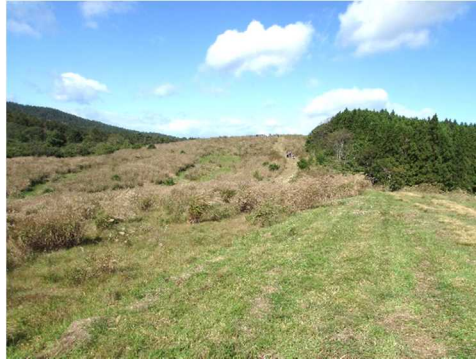
いよいよ狩場の蕨峠頂上。青空が気持ちいい !!