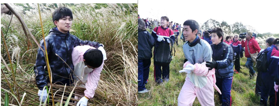
ついに正体をあらわしたうさぎ