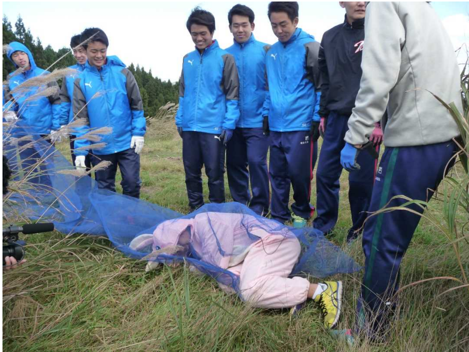
やったぜ!! 網にかかって観念したうさぎ。