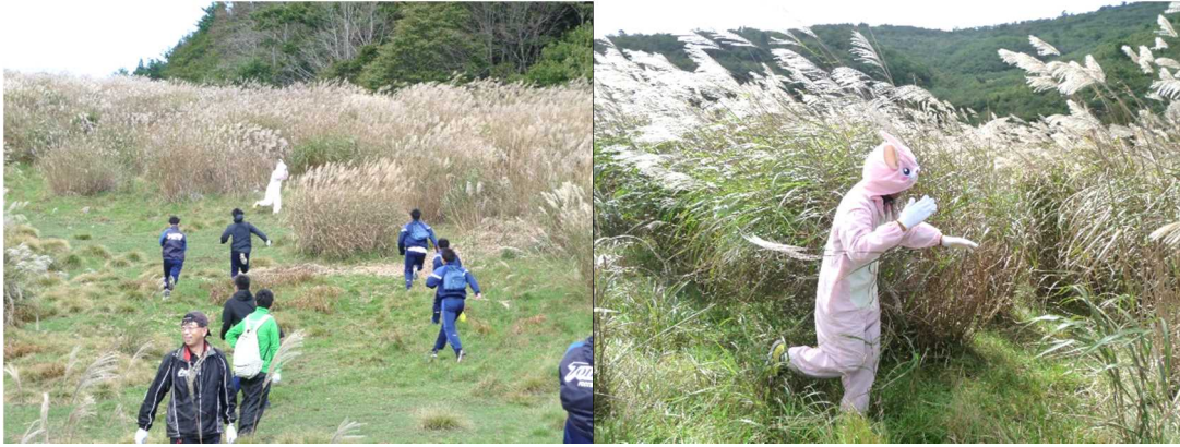
逃げ惑ううさぎたち。それを追いかける隊員たち。