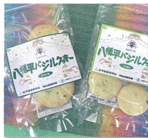
商品開発・バジルクッキー