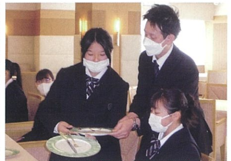
ホテル実習／ANAクラウンプラザリゾート安比高原