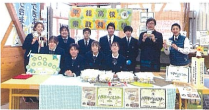
商品開発販売実習／道の駅にしね