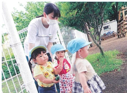
保育実習／杉の子子ども園