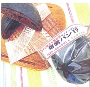
商品開発・熔岩パン

地元農業生産者・企業・行政の協力のもと、オリジナル商品開発・販売を企画運営するなど、幅広い地域資源の活用プロジェクトにも取り組んでいます。