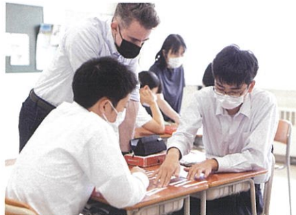
英語 / NS (外国人教師) による授業