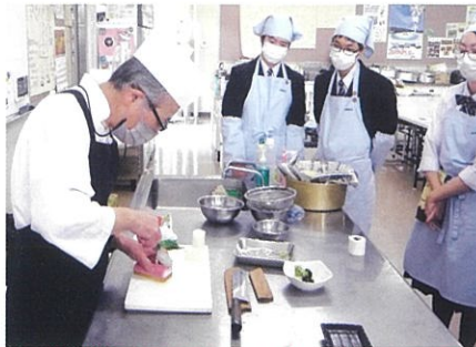
調理技術講習会／いこいの村いわて総料理長

地域文化に密着した科目を学び、地域に貢献できる実践力を高め、地域産業やホテルなどへの就職、調理や栄養など食に関する進学に対応します。