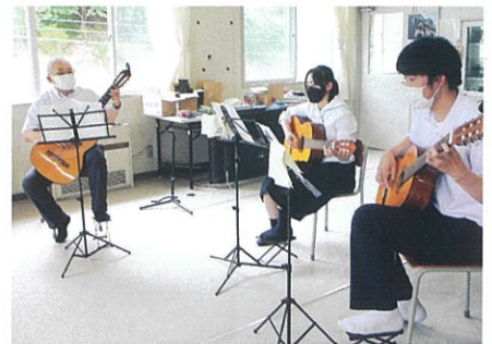
音楽 / ギターの授業