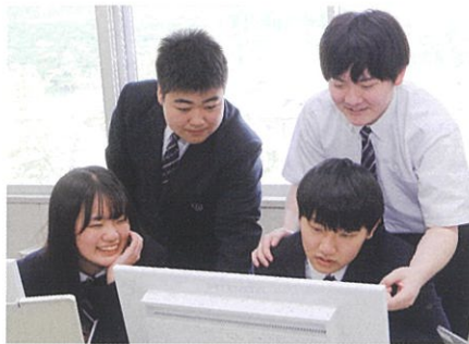
情報処理 / パソコン室での実習