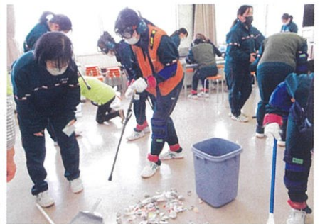
高齢者体験／生活と福祉