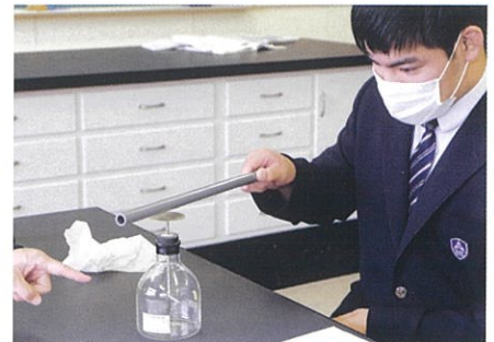
物理 / はく検電器実験