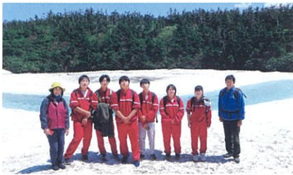
八幡平ドラゴンアイの見学

衣食住や保育・福祉の分野で地域に貢献できる力をつける科目を学び、福祉・販売・事務系への就職、保育・福祉系の進学に対応します。