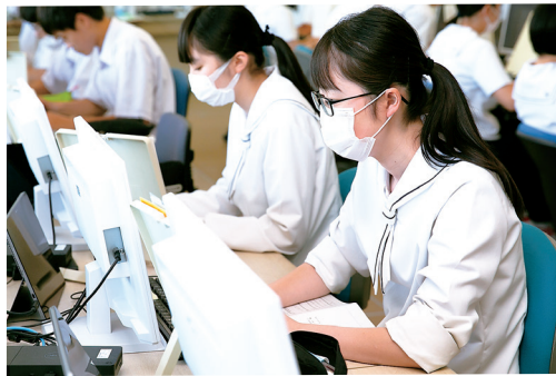
情報処理／パソコン室での実習