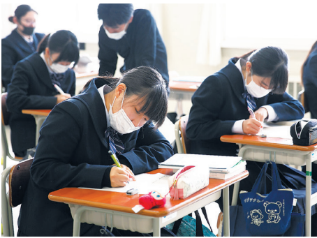
数学／個別の質問に対応

ビジネス基礎、簿記および情報処理といった商業科目を学ぶことができます。インターンシップ（職業体験）など地元企業との連携を図っています。