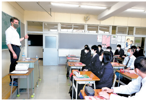
英語／NS（外国人教師）による授業