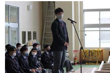
[目標を紹介してくれました]