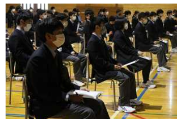
[メモをとり聞くことができました]