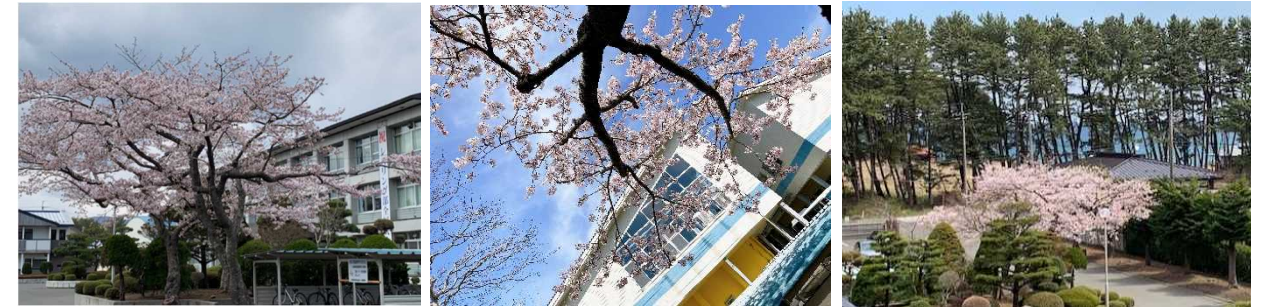
【今年も満開桜が見られました(4月15日(木)撮影) 桜の木々が本校の歴史を見続けてくれています】

毎年5月8日は本校の開校記念日です。これは昭和23年に設立した岩手県立久慈農業高等学校種市分校普通科が5月8日に入学式を挙げていたことによるものです。当時は種市小学校校舎の一隅に教室があり、入学者は32名だったと記録されています。古くから「南部潜りの地」として知られていた種市に潜水学校誘致運動が起こり、昭和27年12月に潜水科が設置され21名が入学し、潜水工学科(S38～)、水中土木科(S47～)と学科改編され、昭和63年に海洋開発科が設置され、現在に至っています。令和2年3月までに6,764名(普通科5,067名、海洋開発科1,697名)の卒業生を輩出している伝統校です。先人たちの苦勞の一端を感じながら現在の種高の存在に感謝し、これから新たな学校を創り上げていきましょう。