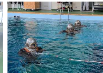
[3年生実習:新入生もできるようになる!!]