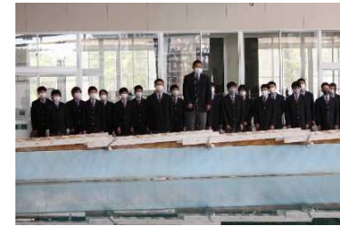
[これからここでたくさん学びます]

4月13日(火)に海洋開発科対面式が本校実習棟プールサイドでおこなわれました。海洋開発科生徒としての意識の高揚と在校生と新入生との交流を図ることを目的に開催され、新入生たちは海洋開発科で学びたいことや自身のこれからの目標について紹介してくれました。式の終わりには先輩方から「南部ダイバー」の紹介があり、新入生たちは海洋開発科に仲間入りすることができました。今年度は県外出身者も多い志高い新入生諸君です。3年間の本校での学習・生活でたくさんのことを学び、心身ともに成長した姿を見せてほしいものです。