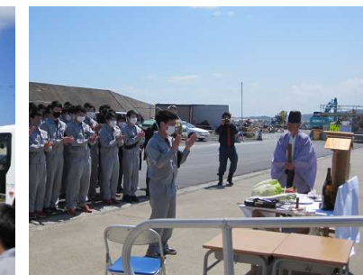
[無事・安全な一年間でありますように]