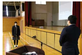
[生徒代表謝辞(生徒会長)]