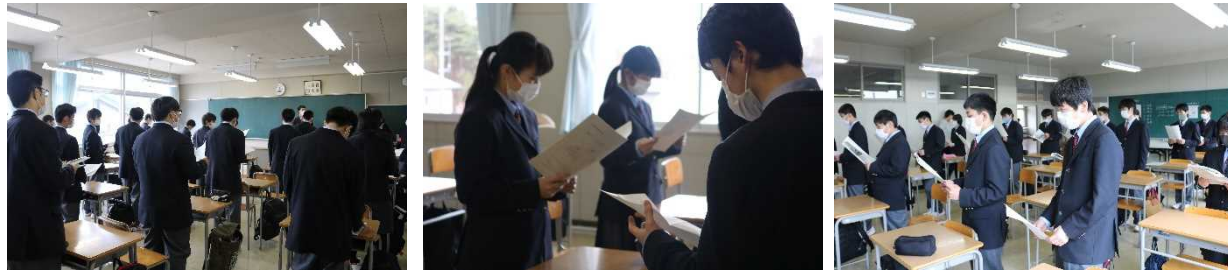
[新入生に対し、応援委委員の先輩たちが丁寧に指導しました]

4月19日(月)～20日(火)に校歌歌唱指導(応援歌練習)がおこなわれました。2,3年生の応援リーダーが中心となり、新入生に対し校歌の歌唱指導をおこないました。新型コロナウイルス感染症予防の観点から、互いにマスクを着用し実施され、大きな声で校歌を発声することもできませんでした。寂しさを感じずにはいられませんが、新入生たちからは一生懸命覚えようとする姿勢が見られました。校歌が歌えることは「種高生の証」です。一日も早く覚え、本校の伝統の継承者のひとりになってもらいたいです。