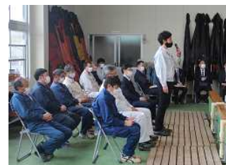
[先生方も新入生にエール]