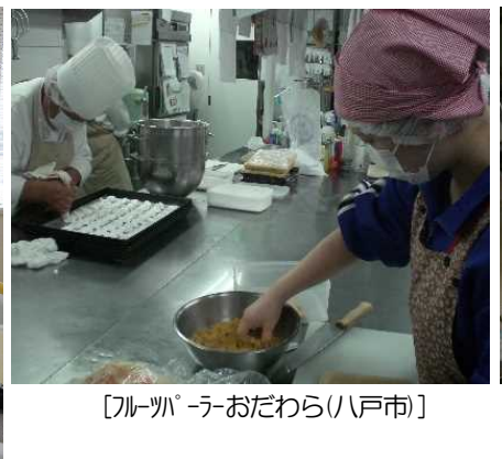
【ルカ -ラーおだわら(八戸市)】