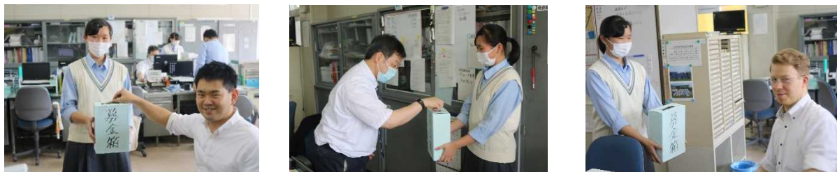
[たくさんの先生方も参加・協力して下さりました。ありがとうございました。]