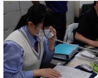
【洋野町役場種市庁舎】