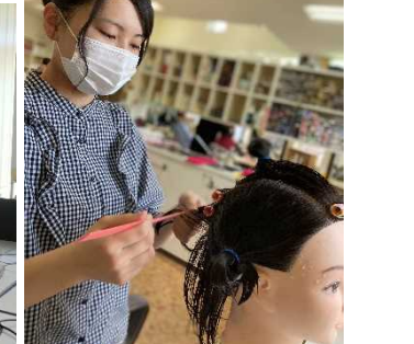
【シルエット美容室(八戸市)】