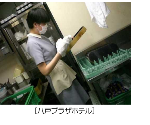
【八戸プラザホテル】