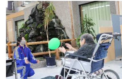
【ユートピア白滝(町内)】