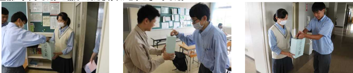
[執行部の生徒たちが各HRや廊下で活動をおこないました。趣旨に賛同して下さり感謝します。]

7月3日(金)以降に、熊本県を中心に九州地方など日本各地で発生した集中豪雨により、多くの方々が被害に遭われました。本校生徒会では執行部の生徒たちが中心となり、被災された方々への支援行動として募金活動を実施することにしました(17日(金)～22日(水))。多くの生徒や先生方が、その趣旨に賛同して下さったおかげでたくさんの募金額になりました。ご協力いただきありがとうございました。