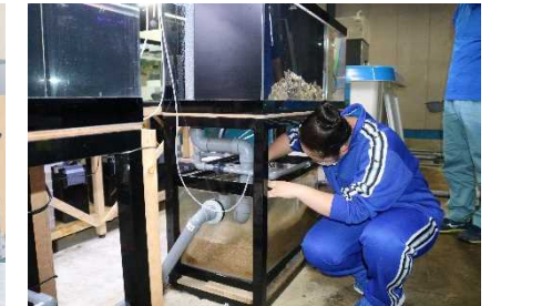
【もぐらんびあ(久慈市)】