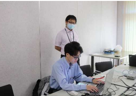
【(株)サン・コンピュータ(八戸市)】