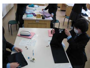
〔エプロン製作(家庭)〕