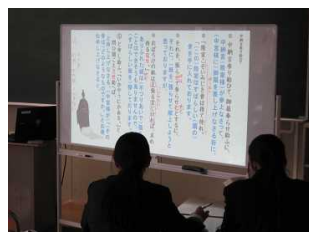
〔映像機器による授業(国語)〕