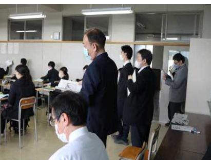
〔先生方も見学し合い研修を深めました〕