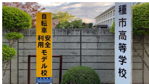
[校門前に設置されているモデル校表示板] (生徒諸君は知っていますよね)