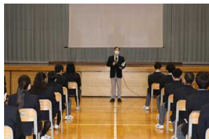
[副校長先生による講師紹介]