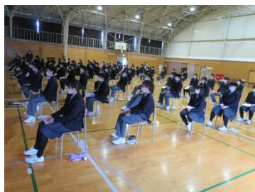
[三密を避けて実施] (広い間隔)