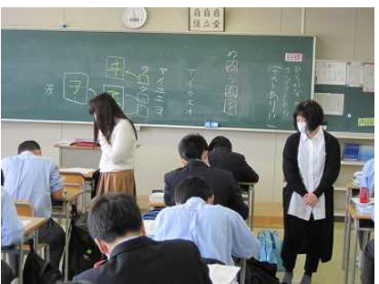
〔複数教員配置による授業展開(国語)〕