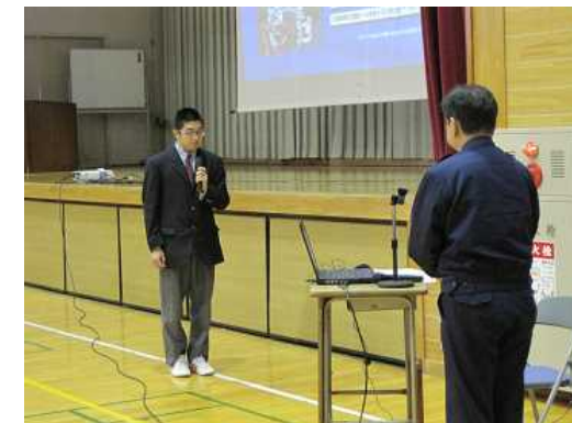
[交通安全委員長による代表挨拶]