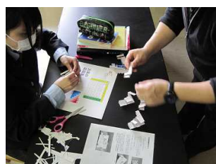
〔周期表モデルの作成(理科)〕