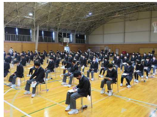
[メモをとりながら受講しました]