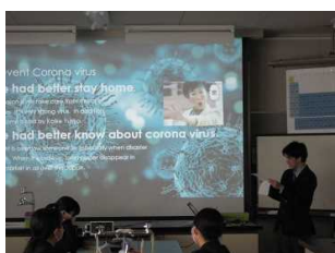
〔プレゼンテーション(英語)〕