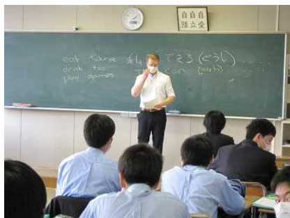
〔外国語指導教員による授業(英語)〕