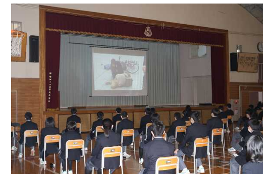
[自分の乗車マナーを考える機会になった]