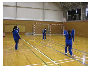
〔バレーボール(体育)〕