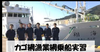
カゴ網漁業乗船実習