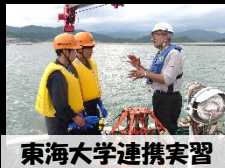
東海大学連携実習