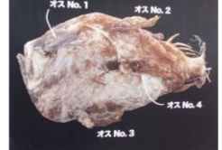
メスの体に吸収されたアンコウのオス

命がけてメスを探す一途な想い、子どものために命を捧げる深い愛情。切なくて泣けるラブストーリーだったべ？ちなみに、市場やスーパーに並ぶアンコウはほとんど全てメスなんだぞ。だから、今日会えたのが最後かもしれない。おらのこと忘れないでくれよな。じゃあの。