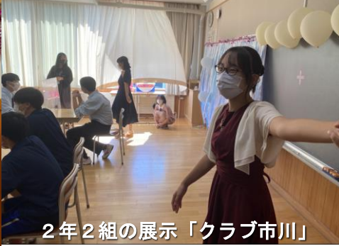
2年2組の展示「クラブ市川」

め、パソコン部によるeスポーツ体験、美術部による黒板アート等様々な発表がなされました。