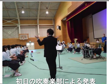
初日の吹奏楽部による発表

生徒による発表は、第一体育館でのステージ部門と、校舎内の各教室等での企画展示部門に分かれて行われましたし、初日の夕方には参加希望生徒による中夜祭も行われました。