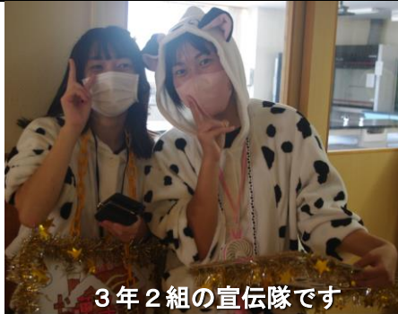
3年2組の宣伝隊です