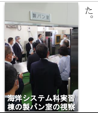
海洋システム科実習棟の製パン室の視察