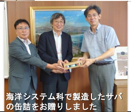
海洋システム科で製造したサバの缶詰をお贈りしました