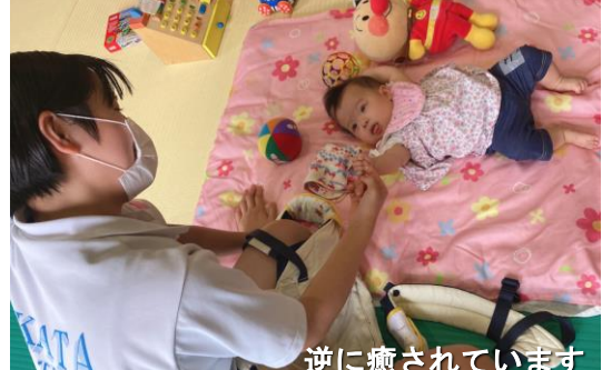
逆に癒されています

た生徒達は、市の保育士、保健師の方々からのご指導を受けながら、実際に乳幼児と触れ合う体験をすることで、個性の異なる子ども達についての理解を深めることができました。実習棟で行われたパン作り体験には、来校された子育て中の母親の皆さんが参加し、パン作りや浮き