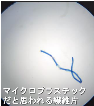
マイクロプラスチックだと思われる繊維片

今回の観察で、エビと同じ甲殻類の仲間であるカイアシ類等の動物プランクトンや、前回の観察では見付からなかったマイクロプラスチックだと思われる繊維片等が見付かりました。