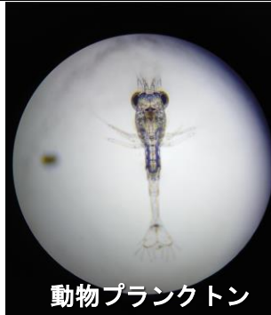
動物プランクトン

七月五日(火)の二・三校時、海洋システム科二年海洋科学コースの生徒が、総合実習の時間に、採取した海水を顕微鏡で観察しました。 五月十七日(火)の授業では、高田松原海岸の砂を観察しましたが、今回は学校近くにある脇之沢漁港で採集した海水を観察しました。