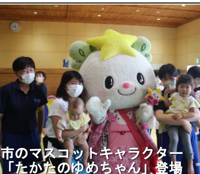
市のマスコットキャラクター「たかたのゆめちゃん」登場

た生徒達は、市の保育士、保健師の方々からのご指導を受けながら、実際に乳幼児と触れ合う体験をすることで、個性の異なる子ども達についての理解を深めることができました。実習棟で行われたパン作り体験には、来校された子育て中の母親の皆さんが参加し、パン作りや浮き