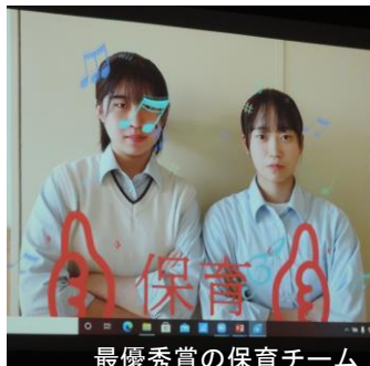
最優秀賞の保育チーム

審査結果は、最優秀賞が保育チームの「音楽が子どもたちの成長に与える効果」、優秀賞が環境チームの「マイクログラスチックとは？高田の現状」、優良賞が教育チームの「夢を持つこと」でした。販売は、海洋システム科のパン販売を始めとして普通科三学年及び二学年による販売が行われました。普通科三学年の各クラスは豪雨被害を受けた丸