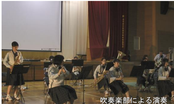
吹奏楽部による演奏

ステージ部門の発表では、書道部の発表や吹奏楽部の演奏、二学年のT×A c t i o nにおける研究発表、九月に開催された岩手県高等学校英語スピーチコンテストに参加した生徒による英語スピーチの発表が行われました。