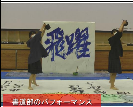
書道部のパフォーマンス

ステージ部門の発表では、書道部の発表や吹奏楽部の演奏、二学年のT×A c t i o nにおける研究発表、九月に開催された岩手県高等学校英語スピーチコンテストに参加した生徒による英語スピーチの発表が行われました。