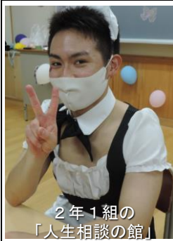
2年1組の「人生相談の館」