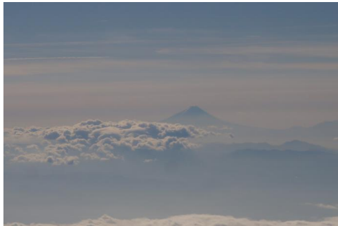
《飛行機から富士山が》

12月1日(土)～4日(火)の3泊4日、2年生が関西への修学旅行に行ってきました。花巻空港と伊丹空港を往復する空路での旅行でした。今年の修学旅行も、充実した研修となりました。帰ってきた生徒たちの表情は少し疲れた様子でしたが、学校では学べない多くのことを吸収した満足感も窺えました。