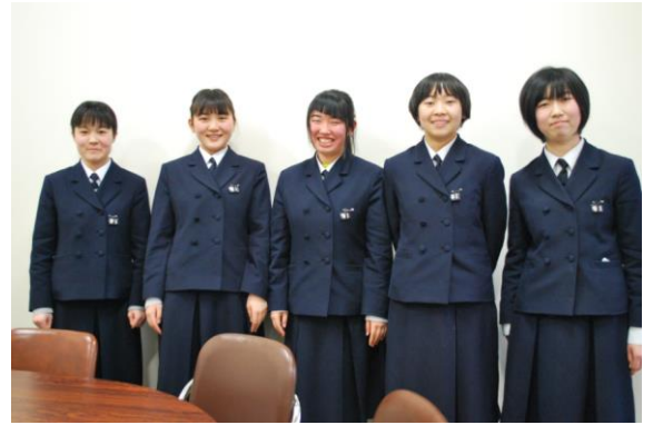
《神田謙一町長様から激励していただきました》