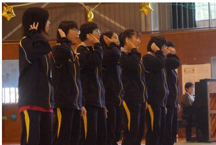
《歌プロによる「輝け住田」披露》