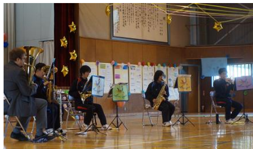
《吹奏楽部&クリス先生の合奏》