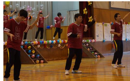
《優勝した3年生のダンス》