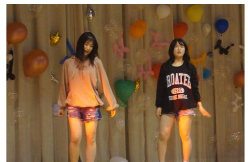
《後夜祭でのキレッキレのダンス披露》