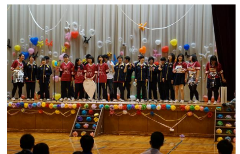
《後夜祭での3年生の発表》