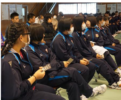
《生徒会企画 ビンゴ大会》