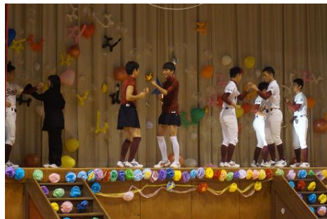
《後夜祭での野球部の発表》