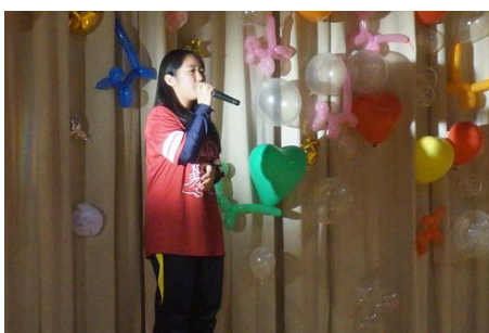
《後夜祭での美声披露》