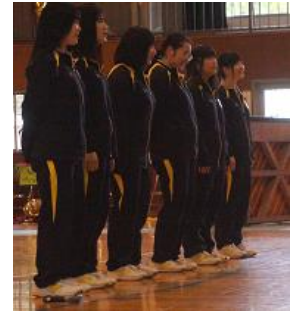
《3年生音楽選択生の合唱》