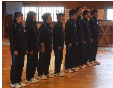
《2年生音楽選択生の合唱》