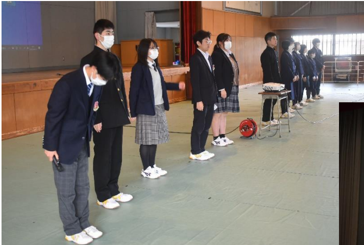
生徒会執行部・各委員会委員長の紹介