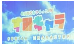
住高キャラ「カメシカ」紹介