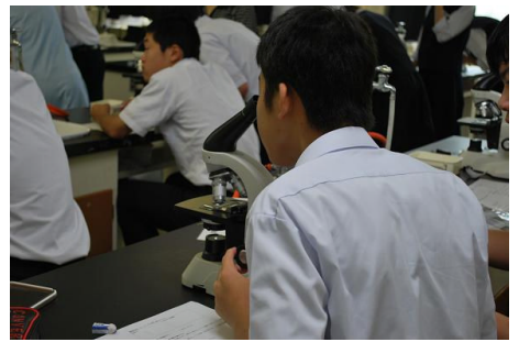
高校教員による授業を体験