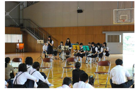
住高祭(文化祭)の説明や部活動の紹介