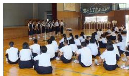
《生徒会執行部紹介》

7月29日(月)、本校で一日体験入学を開催しました。最初に体育館で、生徒会による学校紹介や海外派遣報告、ボランティア活動・部活動の紹介があり、その後、各教室で体験授業が行われました。授業終了後は部活動や研修会館を見学する時間をとりました。研修会館では住田町のスタッフの方々が、かき氷を振る舞って下さり、好評を博しました。非常に暑い中でしたが、中学生の皆さんの真剣な様子が伝わってきました。