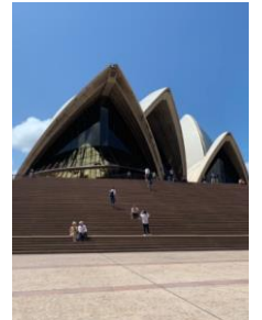
《シドニー・オペラハウス》