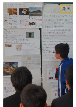
《世田米小学校では、地域創造学の研究発表を聞かせていただきました》