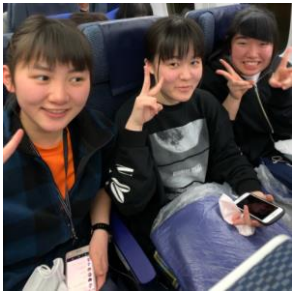
《出発・機内の様子》