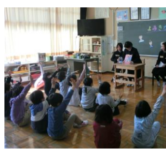
《有住小学校での絵本の読み聞かせ》