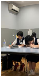
《現地校での授業、バスケもやりました》