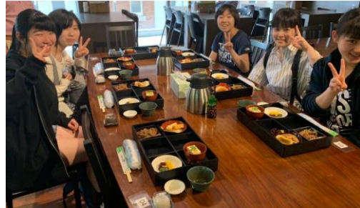
《日本食が恋しくて…》