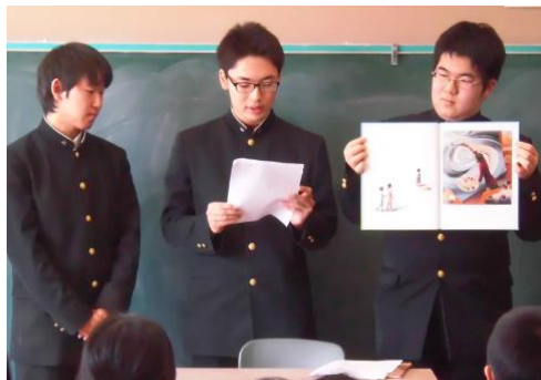
《世田米小学校での絵本の読み聞かせ》