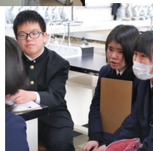
《真剣に話を聞いています》