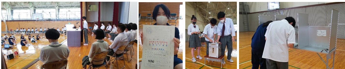
生徒会役員選挙 思いを伝える「立候補者」 投票所入場券 本物の投票箱 投票に臨む「有権者」