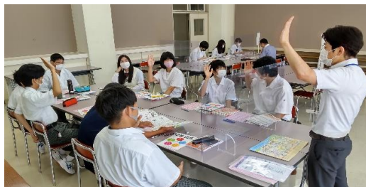
夏季休業 進路ガイダンス 社会への第一歩について学ぶ1年生