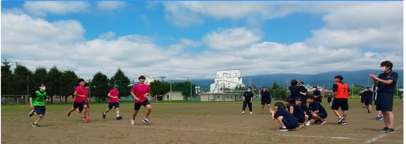
はっきりいって「あづがった」2日間 グラウンドで、体育館で、廊下(?)で 汗とばして熱戦を繰り広げました