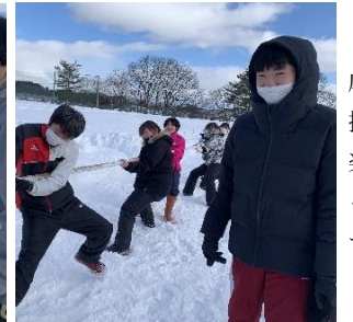
応援 楽 っ す